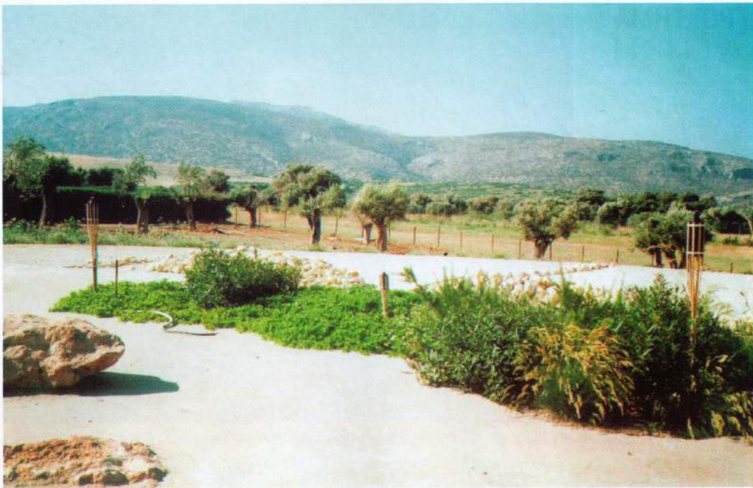
Είδη της μεσογειακής χλωρίδας (μπούζι, ερύγερο, φεστούκα, κ.λπ.) επιλέχθηκαν για την φύτευση των παρτεριών της παραλίας