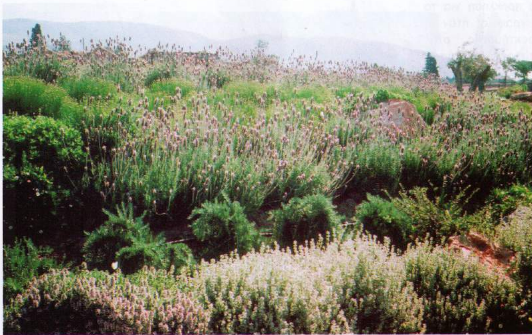
Τα καλύτερα αποτελέσματα επιτεύχθηκαν με απλότητα π.χ. ομαδοποιημένες φυτεύσεις ενός είδους ή μερικά είδη με παρόμοια υφή, μορφή και χρώμα

Ο σχεδιασμός κήπου είναι από τους πιο ειδικούς, απαιτητικούς και υπεύθυνους τομείς της Αρχιτεκτονικής Τοπίου. Ο αρχιτέκτονας τοπίου καλείται να μιλήσει τη διάλεκτο κάθε υλικού –φυσικού και μη– και να βρει το μέσο επικοινωνίας μεταξύ τους, έτσι ώστε όλα να μιλούν την ίδια γλώσσα με το κτί-