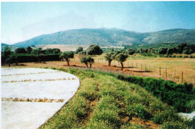
Χαμηλά φυτά εδαφοκάλυψης όπως ερύγερο, γεράνι του Ολύμπου επιλέχθηκαν για το «φρύδι» του πρανούς έτσι ώστε να μην διακόπτεται η φυγή προς τη θάλασσα

Ιδιαίτερη βαρύτητα δόθηκε στο χώρο γύρω από την πισίνα. Στόχος ήταν η φύτευση να ακολουθήσει το γενικότερο σχεδιασμό του χώρου, που επιβάλλει την εικόνα της φυσικής παραλίας. Για το λόγο αυτό προτάθηκαν αλμυρικά και χαμηλά ποώδη φυτά με θυσανωτή και αέρινη εμφάνιση που προσδίδουν την εικόνα των αμμοθινών. Τα είδη που επιλέχθηκαν είναι της μεσογειακής χλωρίδας (μπούζι,