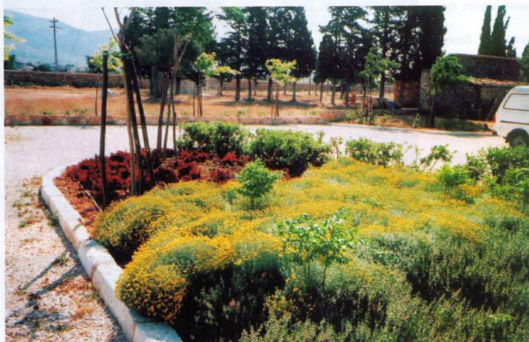
Η επιλογή των φυτικών ειδών, στους χώρους στάθμευσης έγινε με βάση το μέγεθος, τις αποχρώσεις πρασίνου, την εποχή άνθησης, τις απαιτήσεις σε φως και την αντοχή στη σκιά

Το φυσικό περιβάλλον του οικοπέδου χαρακτηρίζεται ως τυπικό Αττικό τοπίο, ως επί το πλείστον ομαλό. Χαρακτηριστικό στοιχείο του κλίματος είναι οι ιδιαίτερα ισχυροί άνεμοι που πνέουν στην περιοχή τους περισσότερους μήνες του χρόνου. Στόχος της μελέτης φύτευσης ήταν: