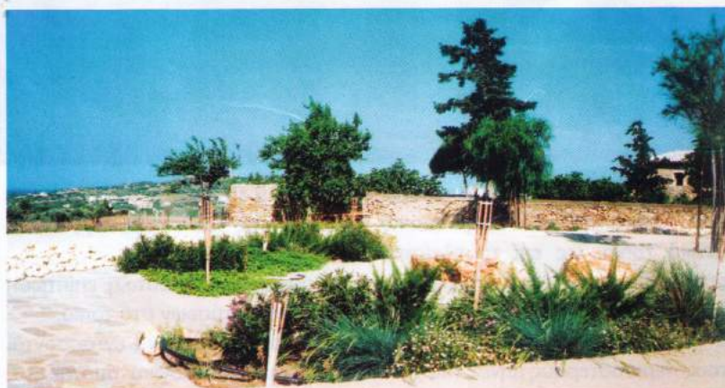
Η φύτευση ακολουθεί το γενικότερο σχεδιασμό του χώρου που επιβάλλει την εικόνα της φυσικής παραλίας