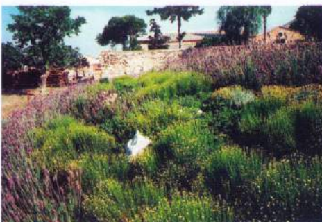
Για την κάλυψη του πρανούς φυτεύτηκαν αρωματικά είδη όπως λεβάντα, λεβαντίνη, δεντρολίβανο έρπων και θυμάρι