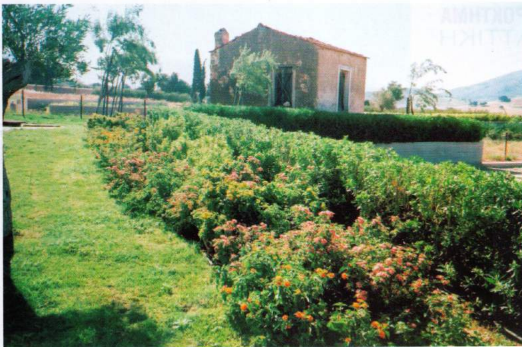
Η φύτευση των θάμνων ακολούθησε τη γεωμετρική μορφή της μπορντούρας η οποία σιγά σιγά εκφυλιζόταν σε πιο φυσικούς σχηματισμούς