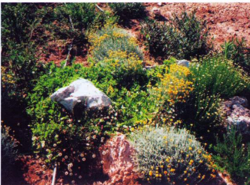
Ομαδοποιημένες συνθέσεις φυτών ενσωματώθηκαν διακριτικά μέσα σε σχισμές βράχων