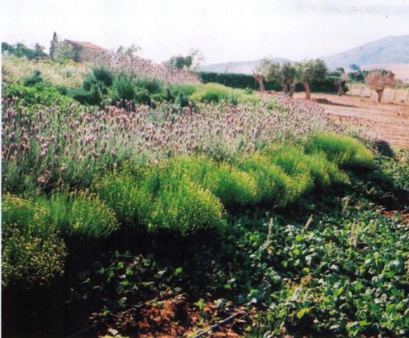
Στον πόδα του πρανούς επιλέχθηκαν είδη εδαφοκάλυψης όπως αγιούκα και κισσός.