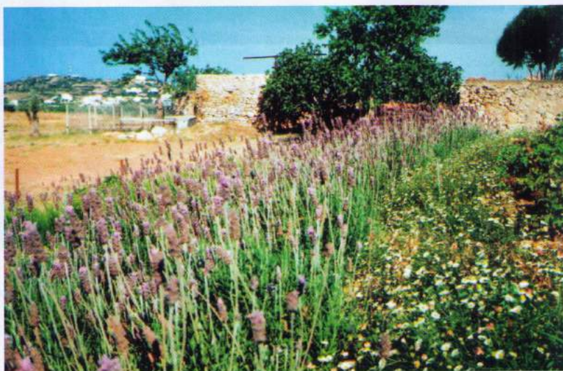
Ποικιλία μορφών και χρωμάτων κυριαρχούν στη φύτευση του κήπου