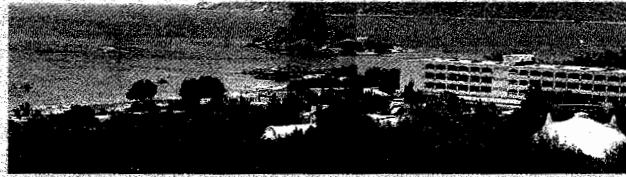
Φωτογραφία 1. Άποψη του Club Med και του νησιού Καστρί από

Σήμερα ο τουρισμός αποτελεί την κύρια πλουτοπαραγωγική πηγή της Κεφάλου. Η περιοχή ήταν αρχικά αγροτική, με διάσπαρτα κτίσματα που λειτουργούσαν ως εξοχικά για τους Κεφαλιανούς κατά την περίοδο 1970-1980, με την άνθηση της εμπορικής ναυτιλίας και την αύξηση του οικογενειακού εισοδήματος, μετασηματίστηκε σε τουριστική (Παπαντωνίου, Γ., Παπαντωνίου, Δ. 1998). Το 1981, με την εμφάνιση του ξενοδοχείου Σύνδει στη Σκάλα (παλιό λιμάνι) και του Club Med πλησίον της βασιλικής του Αγίου Στεφάνου, εισάγεται στην περιοχή ο μαζικός τουρισμός, και τα πρώτα μπαγκαλόου, ταβέρνες και καφετέριες κάνουν την εμφάνισή τους (Χάρτης 3). Το 1995, παρουσιάζεται εγκατάλειψη των αγροτικών γαιών και έντονη οικιστική ανάπτυξη κατά μήκος του κεντρικού παραλιακού δρόμου, με πύκνωση των τουριστικών χρήσεων (Χάρτης 3). Η αύξηση των τουριστικών εγκαταστάσεων πραγματοποιείται εις βάρος του πρασίνου και των καλλιεργήσιμων εκτάσεων.